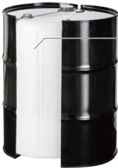
ポリエチレン内装容器 (ライナー)